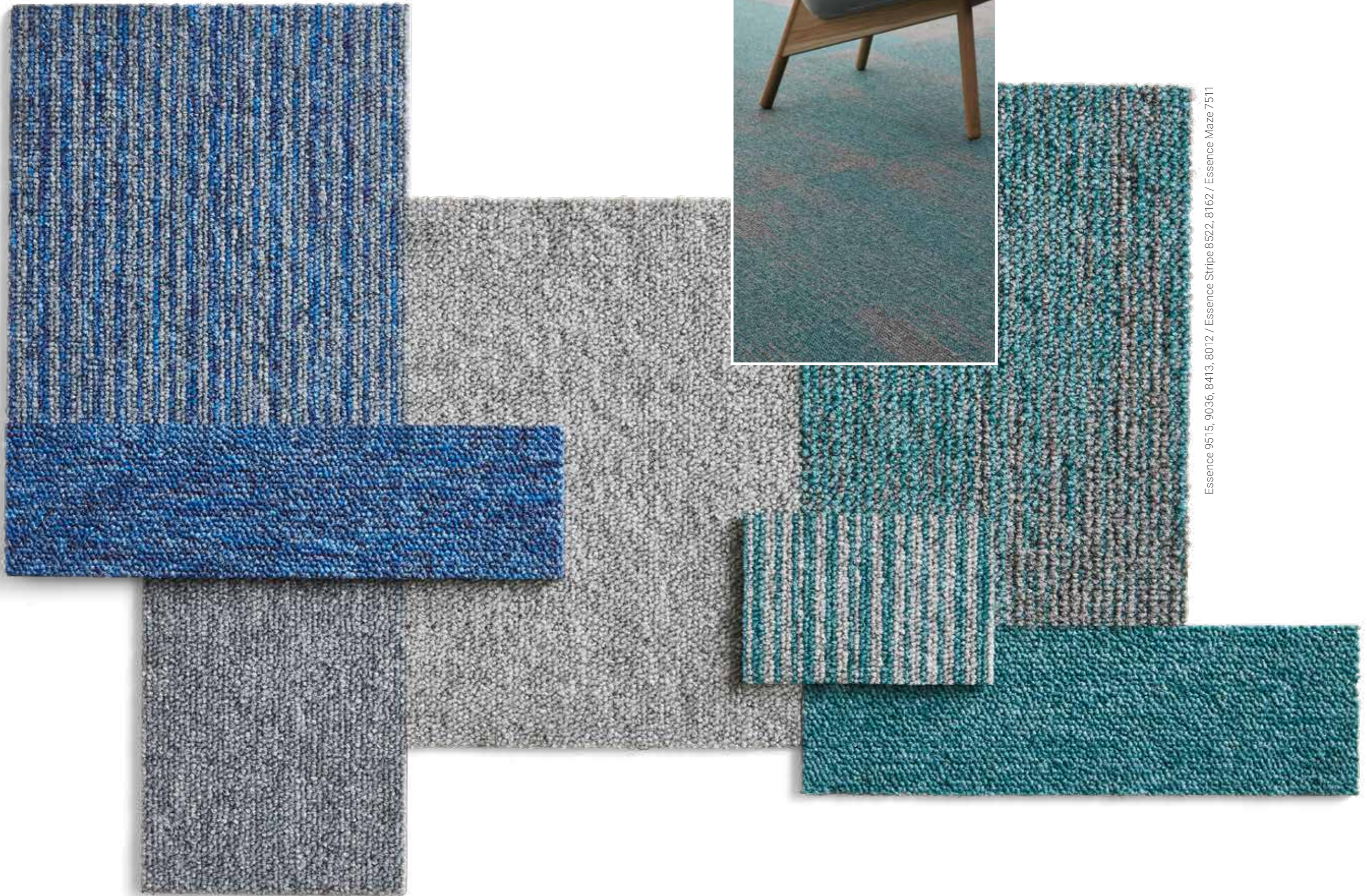
Essence 9515, 9036, 8413, 8012 / Essence Stripe 8522, 8162 / Essence Maze 7511